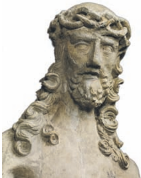
Christus op de koude steen, deel van een beeldengroep die de zogeheten 'Gregoriusmis' uitbeeldt.

Deze schatten werden op vrijdag 15 november gepresenteerd middels een rijk geïllustreerd puik boekwerk met de titel De Hemel op aarde . Een belangrijk deel van